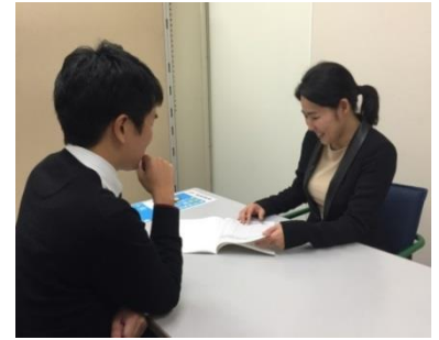
キャリアコンサルティングの様子